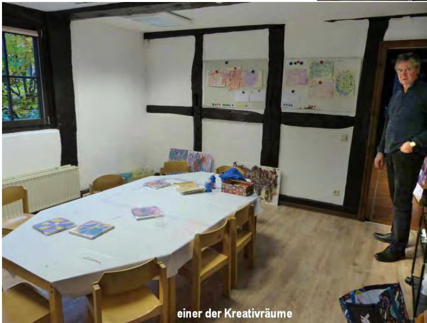
einer der Kreativräume