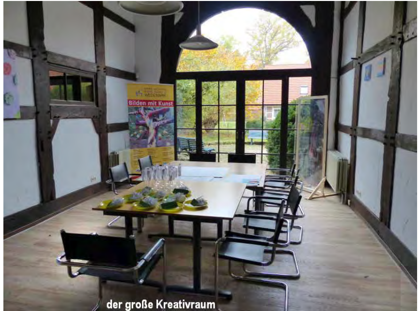
der große Kreativraum

Bei der Kinder- und Jugendkunstschule war nach zufällig ebenfalls 30 Jahren Bedarf an neuen Räumlichkeiten, denn 700 bis 800 Kinder/Jugendliche brauchen für 50 verschiedene Kurse reichlich